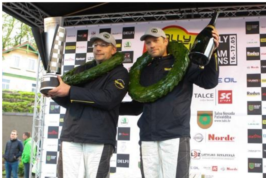
Čempionu Kausa ieguvēji 2015. gadā